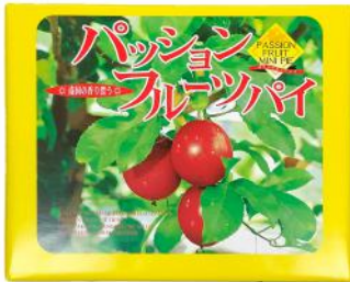
八丈島 パッションフルーツパイ