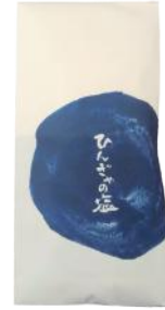
青ヶ島 ひんぎゃの塩 (100g)