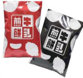
伊豆大島 牛乳煎餅 ※赤・黒の中身は同じです