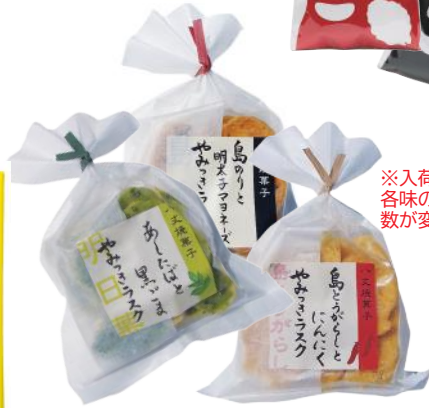
八丈島 やみつきラスク 各種 島唐辛子とんにく・ あしたばと黒ゴマ・ 島のりと明太子マヨネーズ