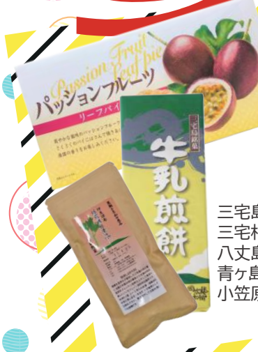
三宅島 牛乳煎餅 三宅村 焙煎明日葉茶 八丈島 島のり 青ヶ島 ひんぎゃの塩 (50g) 小笠原 パッションフルーツリーフパイ