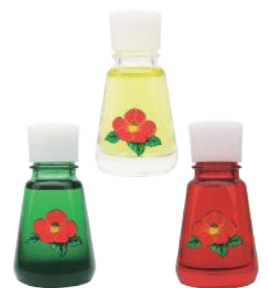
伊豆大島 三原椿油 ミニボトル