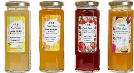
三宅島 三宅島のフルーツソース 各種 あまなつ・島レモン・完熟イチゴ・パッションフルーツ